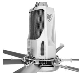
Blanco con plateado