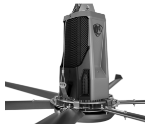
Plateado con negro